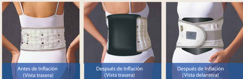
Los Paneles separables, Posteriores y Anterior Incluyeron, (no Mostrado)

El único e innovador diseño de nuestro corsé continua socorro terapéutica en el ir que permitirá a su paciente la libertad para regresar a una activa vida despreocupada. (The unique and innovative design of our brace will provide continuous therapeutic relief on the go that will allow your patient the freedom to return to an active carefree lifestyle)