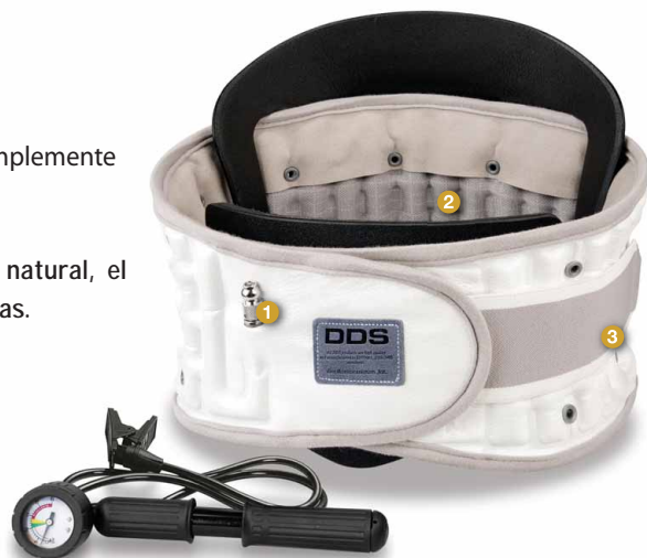
Entregue la bomba de aire manual es incluido