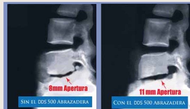
Figura 1 (Radiografía antes de la aplicación) El intervalo entre vértebras lumbares: 8 Mm Figura 2 (Radiografía después de la aplicación) El intervalo entre vértebras lumbares: 11 Mm (aumentado por 3 Mm)

Las radiografías presentadas aquí muestran claramente el alargamiento realiza el DDS que 500 Refuerzo Lumbar de Descompresión de Espinal-Aire LSO tiene en la espina dorsal Lumbar. El antes que y después de que imágenes de radiografía demuestran visiblemente un aumento general de la curvatura anterior de la espina dorsal lumbar al aumentar el espacio entierra-vertebral de disco en el L4 y la región L5 una distancia mensurable media de 3 Mm.